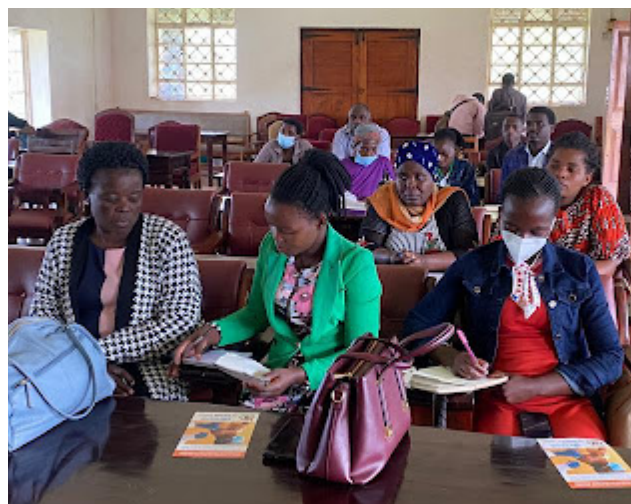
Photo de groupe avec certains des participants au niveau sous-national (district de Kabale) au siège du district lors de l'atelier au niveau du district.